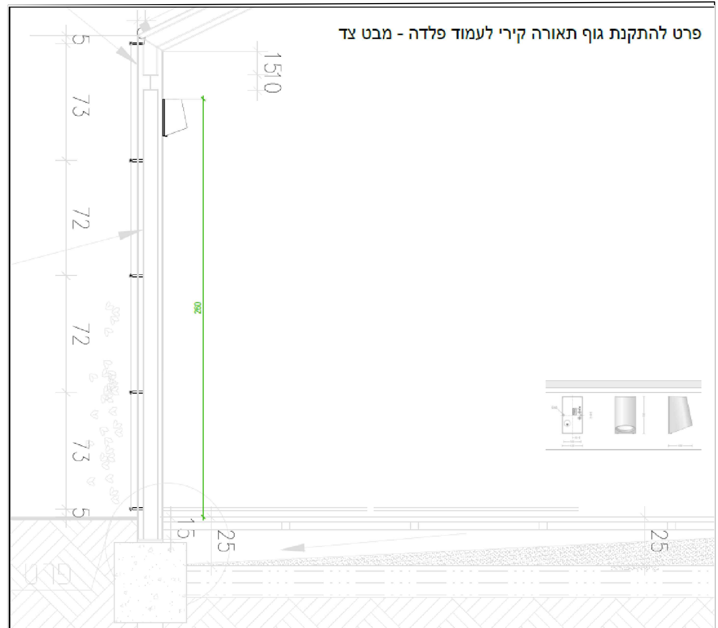
פרט עקרוני - מבט מהצד לקוח מתכנית יועץ תאורה